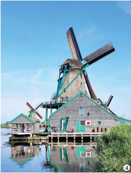
1 벨기에 브뤼셀 그랑플라스 2 벨기에 브뤼셀 그랑플라스 오줌싸개 동상 3 독일 에센 유네스코 문화유산 줄버레인 탄광 산업단지 4 네덜란드 암스테르담 잔세스칸스 5 네덜란드 암스테르담 운하